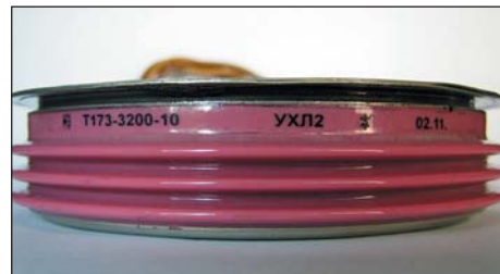
Рис. 3. Фальсифицированная маркировка тиристора Т173 производства ОАО «Электровыпрямитель», выполненная прозрачной липкой лентой (дата на маркировке 02.11, а фактически тиристор произведен не позднее 2000 г.)

Следует также заметить, что применение старых полупроводниковых приборов, бывших в эксплуатации и выработавших свой ресурс, является крайне нежелательным, так как сопряжено с риском возникновения аварии даже в ненагруженных режимах эксплуатации. Механизмы старения полупроводниковых приборов рассматривались в огромном количестве литературы, поэтому отметим только, что длительная эксплуатация СПП приводит, в первую очередь, к возрастанию обратных токов и токов