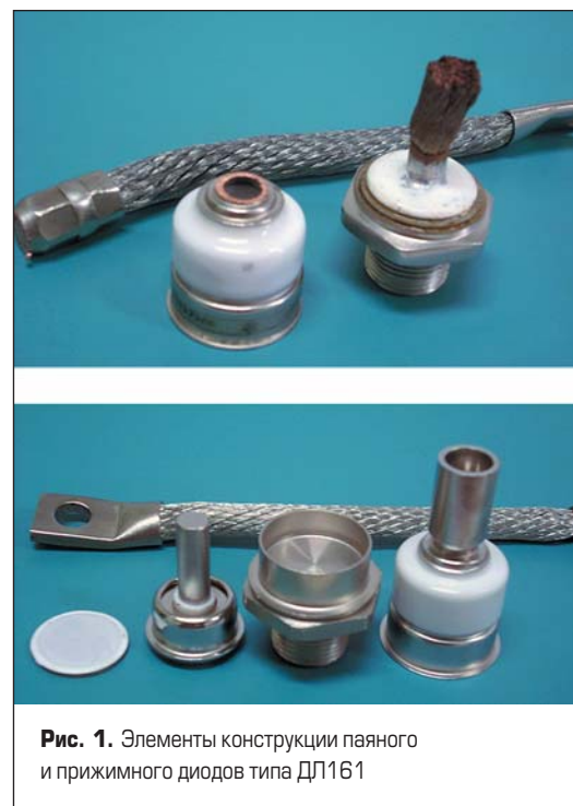
Рис. 1. Элементы конструкции паяного и прижимного диодов типа ДЛ161

Итак, в феврале 2010 г. в лабораторию на исследование поступила партия диодов ДЛ161-200-12, предназначенная для поставки на одну из железных дорог Украины (рис. 1). Диоды были замаркированы товарным знаком, похожим на товарный знак ООО «Элемент-Преобразователь», но по целому ряду особенностей не соответствовали действующей на предприятии конструкторской документации. В частности, диоды были не лавинными и имели паяную конструкцию. Кроме того, значения импульсного прямого напряжения ( U_{FM} ) не соответствовали требованиям п. 6.9.2. «Руководства на ремонт выпрямительной установки при капитальном ремонте КР-1 и КР-2 тепловозов» от 16.05.1991 г. (первая группа диодов должна иметь значения импульсного прямого напряжения 1,11–1,16 В, вторая — 1,17–1,24 В).